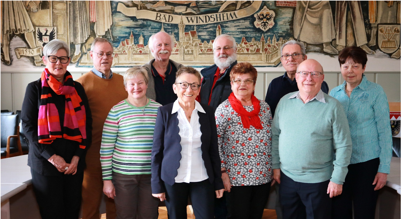
Das ist der aktuelle Vorstand des Seniorenrats Bad Windsheim

Im Sommer 2019 feierte der Seniorenrat Bad Windsheim seinen 20. Geburtstag. Dieses Jahr wird er 25! Im Lauf der Zeit hat die anfängliche Interessengemeinschaft, die inzwischen ein eingetragener Verein ist, vielfältige Aktivitäten entwickelt. Ihr Ziel: Den älteren Bürgern in der Stadt soll ein Angebot an Veranstaltungen gemacht werden, das unterhaltsam ist, aber auch Informationen bietet und die Gemeinschaft fördert. Außerdem will der Verein die Interessen der Senioren gegenüber der Politik auf mehreren Ebenen vertreten und sich mit anderen Senioren-Organisationen vernetzen.